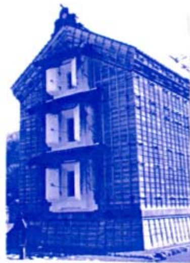
にしん御殿の蔵(地下1階上3F)

夜はおいしい海の幸と堪能しながら、布団屋主人と布団談義に花と咲かせ、もっと色々見て回りたいので、最終の閑空行きの飛行機に乗り込めました。