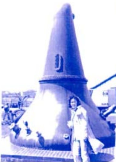
(ポットスタイル蒸溜釜の前)

いたのかと思っていたら、こにしん御殿とそっくりのセットを大阪のスタジオで作って撮影されていたそう。ほんまに、そっくりなんです。泉から海までにしんを運ぶレールが引いてある。最盛期には40軒位のにしん御殿があつたそう。当時の盛栄ぶりかうかがえます。