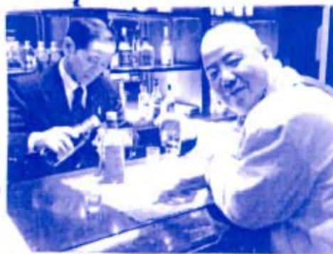
(竹鶴20年もの飲むところ)

いたのかと思っていたら、こにしん御殿とそっくりのセットを大阪のスタジオで作って撮影されていたそう。ほんまに、そっくりなんです。泉から海までにしんを運ぶレールが引いてある。最盛期には40軒位のにしん御殿があつたそう。当時の盛栄ぶりかうかがえます。